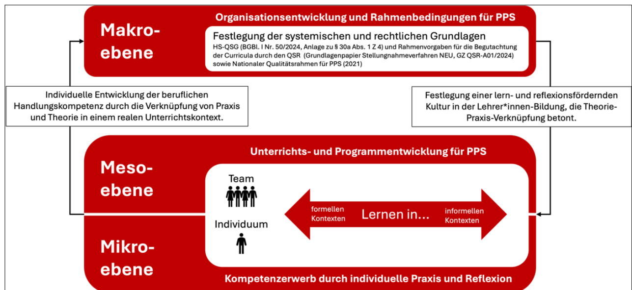
Abbildung 2: Zusammenhang zwischen individueller Kompetenz-, Unterrichts-/Programm- und Organisationsentwicklung im Kontext der PPS (Bauer et al., 2025)

Die didaktische Gestaltung von Lernprozessen und der Theorie-Praxis-Transfer im Rahmen der PPS erfolgen auf unterschiedlichen Ebenen: der Makro-, Meso- und Mikroebene (vgl. Bauer et al., 2025). Abbildung 2 verdeutlicht das Zusammenspiel dieser drei Ebenen: Auf der Makroebene schaffen rechtliche und organisatorische Vorgaben die Rahmenbedingungen für Lernprozesse und Kompetenzentwicklung (vgl. HS-QSG idgF; HG 2005 idgF). Die Mesoebene übersetzt diese in Formate, die Theorie und Praxis systematisch miteinander verbinden (vgl. Dehnpostel, 2016; Neuweg, 2022; Schön, 1983, 1987), etwa durch schulpraktische Übungen, Praxistransfer oder Portfolioarbeit (vgl. Bräuer, 2016). Auf der Mikroebene schließlich steht die individuelle Kompetenzentwicklung der Studierenden im Mittelpunkt, die durch eigenständiges Unterrichten, Reflexion und Feedback gezielt gefördert wird (vgl. Bräuer, 2016; Dreyfus & Dreyfus, 1980, 1987; Schön, 1983, 1987).