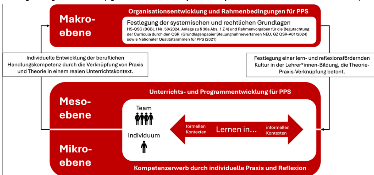
Abbildung 2: Zusammenhang zwischen individueller Kompetenz-, Unterrichts-/Programm- und Organisationsentwicklung im Kontext der PPS (Bauer et al., 2025)

Die didaktische Gestaltung von Lernprozessen und der Theorie-Praxis-Transfer im Rahmen der PPS erfolgen auf unterschiedlichen Ebenen: der Makro-, Meso- und Mikroebene (vgl. Bauer et al., 2025). Abbildung 2 verdeutlicht das Zusammenspiel dieser drei Ebenen: Auf der Makroebene schaffen rechtliche und organisatorische Vorgaben die Rahmenbedingungen für Lernprozesse und Kompetenzentwicklung (vgl. HS-QSG idgF; HG 2005 idgF). Die Mesoebene übersetzt diese in Formate, die Theorie und Praxis systematisch miteinander verbinden (vgl. Dehnbostel, 2016; Neuweg, 2022; Schön, 1983, 1987), etwa durch schulpraktische Übungen, Praxistransfer oder Portfolioarbeit (vgl. Bräuer, 2016). Auf der Mikroebene schließlich steht die individuelle Kompetenzentwicklung der Studierenden im Mittelpunkt, die durch eigenständiges Unterrichten, Reflexion und Feedback gezielt gefördert wird (vgl. Bräuer, 2016; Dreyfus & Dreyfus, 1980, 1987; Schön, 1983, 1987).