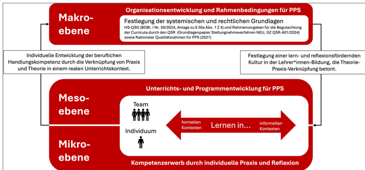
Abbildung 2: Zusammenhang zwischen individueller Kompetenz-, Unterrichts-/Programm- und Organisationsentwicklung im Kontext der PPS (Bauer et al., 2025)

Die didaktische Gestaltung von Lernprozessen und der Theorie-Praxis-Transfer im Rahmen der PPS erfolgen auf unterschiedlichen Ebenen: der Makro-, Meso- und Mikroebene (Bauer et al., 2025). Abbildung 2 verdeutlicht das Zusammenspiel dieser drei Ebenen: Auf der Makroebene schaffen rechtliche und organisatorische Vorgaben die Rahmenbedingungen für Lernprozesse und Kompetenzentwicklung (HS-QSG idgF.; HG 2005 idgF.). Die Mesoebene übersetzt diese in Formate, die Theorie und Praxis systematisch miteinander verbinden (Dehnbostel, 2016; Neuweg, 2022; Schön, 1983, 1987), etwa durch schulpraktische Übungen, Praxistransfer oder Portfolioarbeit (vgl. Bräuer, 2016). Auf der Mikroebene schließlich steht die individuelle Kompetenzentwicklung der Studierenden im Mittelpunkt, die durch eigenständiges Unterrichten, Reflexion und Feedback gezielt gefördert wird (Bräuer, 2016; Dreyfus & Dreyfus, 1980, 1987; Schön, 1983, 1987).