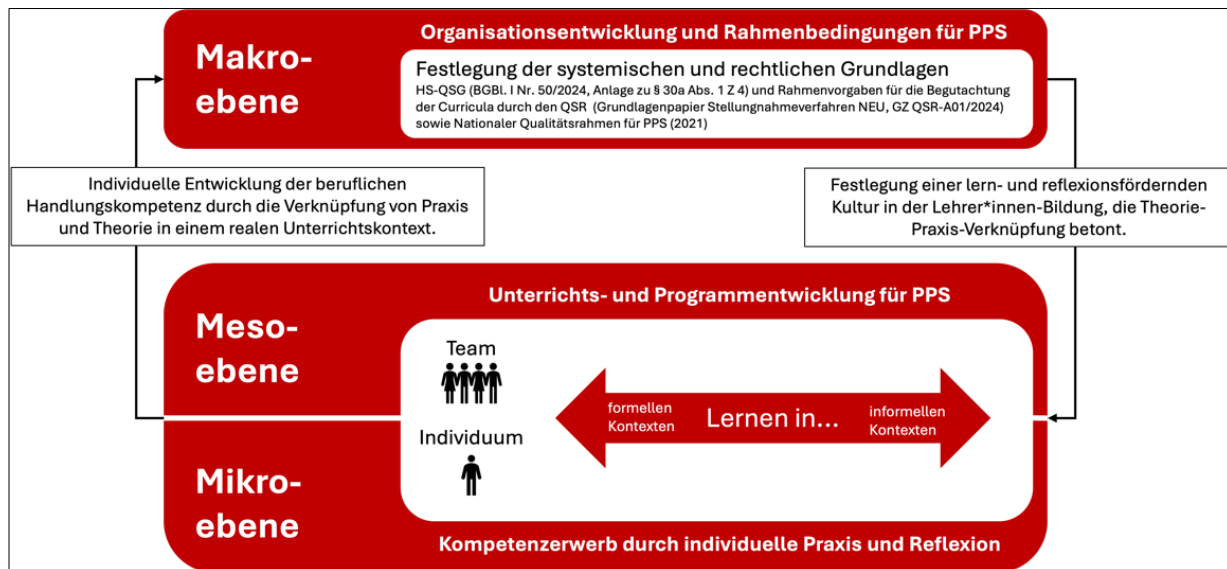
Abbildung 2: Zusammenhang zwischen individueller Kompetenz-, Unterrichts-/Programm- und Organisationsentwicklung im Kontext der PPS (Bauer et al., 2025)

Die didaktische Gestaltung von Lernprozessen und der Theorie-Praxis-Transfer im Rahmen der PPS erfolgen auf unterschiedlichen Ebenen: der Makro-, Meso- und Mikroebene (Bauer et al., 2025). Abbildung 2 verdeutlicht das Zusammenspiel dieser drei Ebenen: Auf der Makroebene schaffen rechtliche und organisatorische Vorgaben die Rahmenbedingungen für Lernprozesse und Kompetenzentwicklung (HS-QSG idgF; HG 2005 idgF). Die Mesoebene übersetzt diese in Formate, die Theorie und Praxis systematisch miteinander verbinden (Dehnbostel, 2016; Neuweg, 2022; Schön, 1983, 1987), etwa durch schulpraktische Übungen, Praxistransfer oder Portfolioarbeit (Bräuer, 2016). Auf der Mikroebene schließlich steht die individuelle Kompetenzentwicklung der Studierenden im Mittelpunkt, die durch eigenständiges Unterrichten, Reflexion und Feedback gezielt gefördert wird (Bräuer, 2016; Dreyfus & Dreyfus, 1980, 1987; Schön, 1983, 1987).