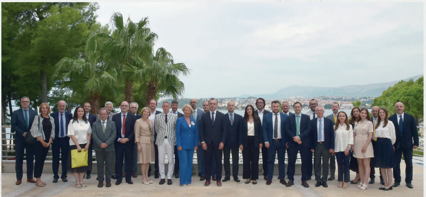
Der 45. Workshop der Studiengruppe „Regional Stability in South East Europe“ in Split