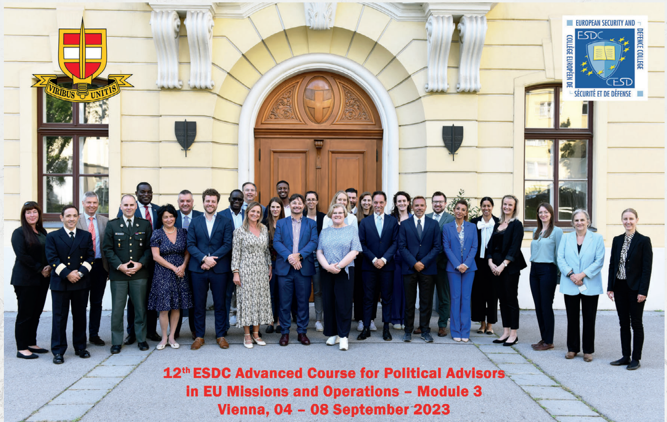
12 th ESDC Advanced Course for Political Advisors in EU Missions and Operations – Module 3 Vienna, 04 – 08 September 2023

Gegründet im Jahr 2005 ist das „European Security and Defence College“ ein Netzwerk von Instituten und Akademien im Bereich Verteidigungs- und Sicherheitspolitik. Ziel des ESDC ist es, ein gemeinsames Verständnis der „Gemeinsamen Sicherheits- und Verteidigungspolitik“ der EU im Gesamtkontext der „Gemeinsamen Außen- und Sicherheitspolitik“ bei zivilem und militärischem Personal zu fördern. Auf diese Weise ergänzt das „European Security and Defence College“ die nationalen Bemühungen auf dem Gebiet der Aus- und Weiterbildung.