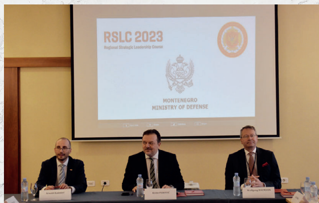
Zweites Modul des RSLC