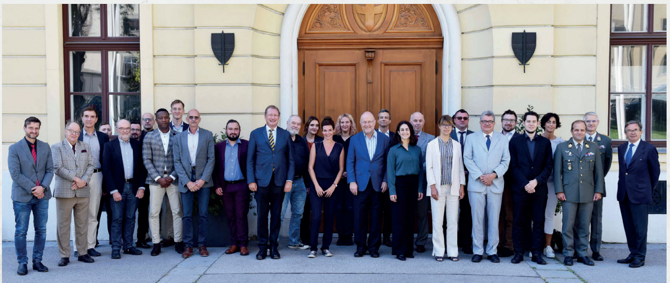
Die WIFIS-Jahrestagung 2023