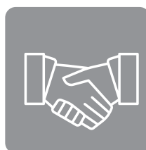
Gesundheits- und Ernährungssoziologie