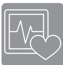
Sozial- und Gesundheitsmanagement