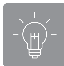
Didaktische Ansätze zur Kompetenzentwicklung